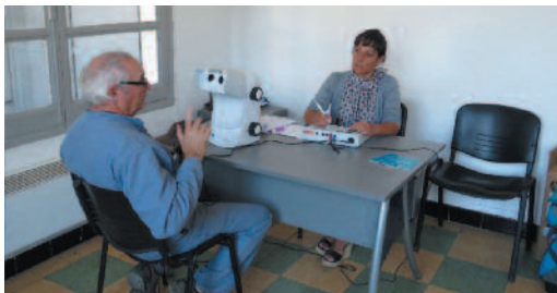
Examen médical d'aptitude