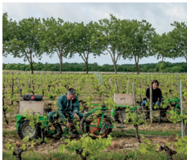
Château La Fleur des Aubiers (33)

Présents sur l'ensemble du territoire, les médecins du travail, les infirmiers en santé au travail et les conseillers en prévention des risques professionnels sont à l'écoute de vos problématiques de santé et de sécurité au travail, que vous soyez salarié agricole ou exploitant, employeur de main d'œuvre ou pas. Ces professionnels peuvent vous apporter des solutions adaptées et personnalisées dans le cadre de la santé sécurité au travail.